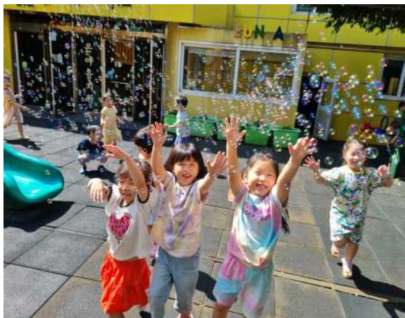
<친구들과 안전하게 놀이해요.>