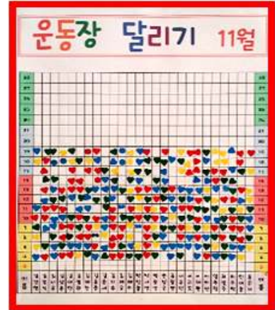
<교실로 올라가 스스로 달리기 스티커 부착>