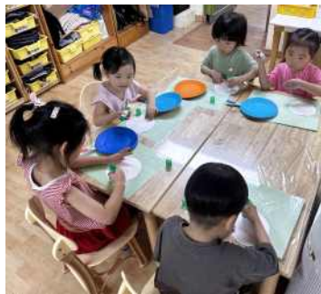
<다양한 자료를 이용하여 만들기를 해요>