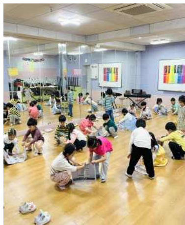
<친해지는 신문지 게임을 해요>