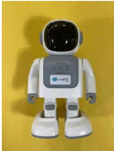
<6세 - 씩고>