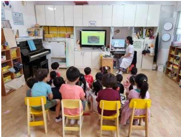
<올바른 식사에절에 대해 알아보아요.>