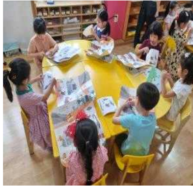
<과학 활동하는 모습>