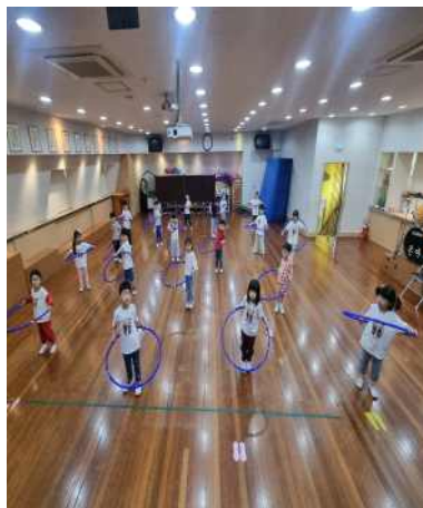
< 6세 - 훌라후프 >