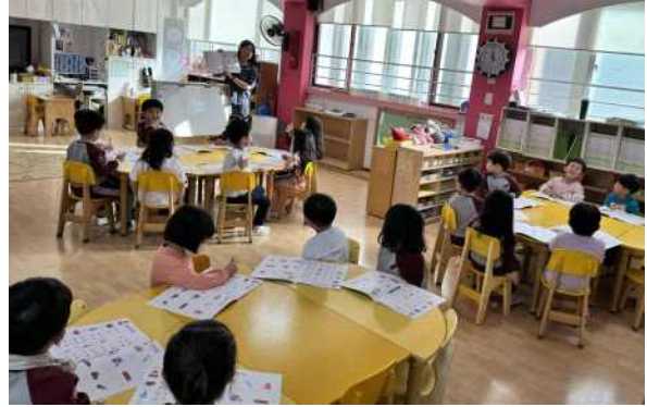
<수 교재를 이용해 활동하는 모습>