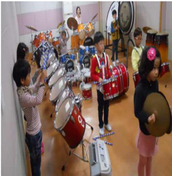
<마칭 연주 모습>