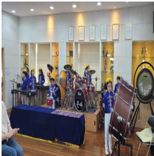
<마칭 연주 모습>