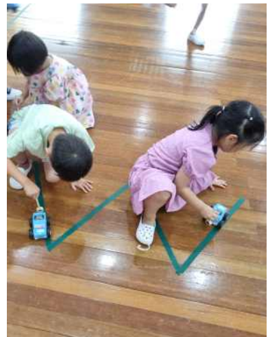
<과학교구를 이용한 자유놀이>