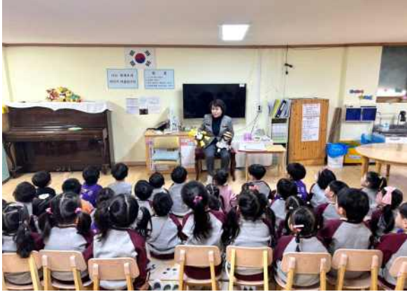
<나는 스스로 하는 은아어린이입니다.>