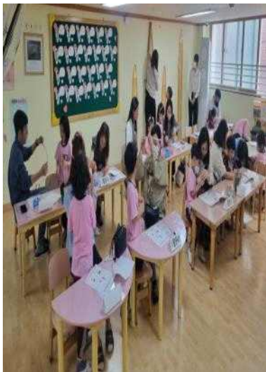
<경험 회상 후 브레인스토밍 활동 및 주제망 구성하기>