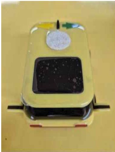
<5세 - 고카>