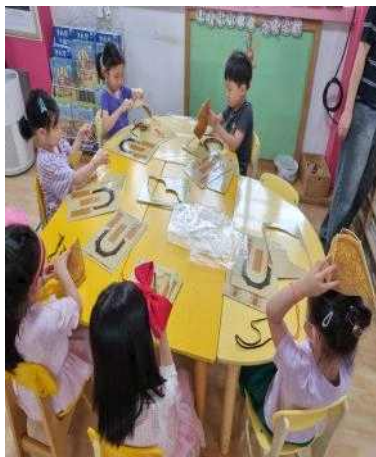
<6세 역사 독서 교육 - 만들기>