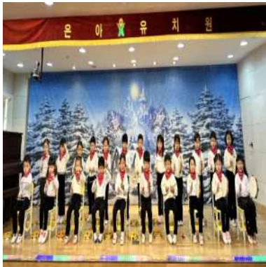
<5세 - 리듬악기>