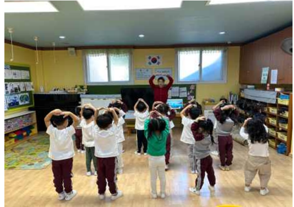
<음악에 맞춰 신나는 율동을 해요>