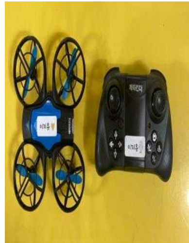
<7세 - 드론>