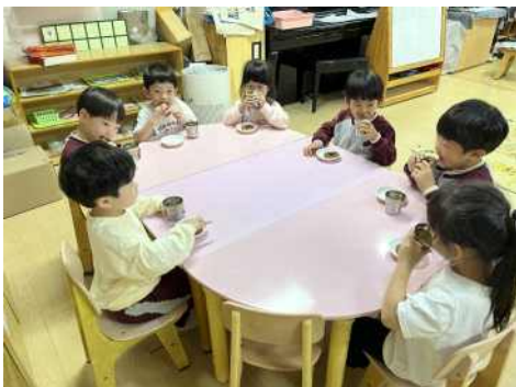
<간식 먹는 모습>