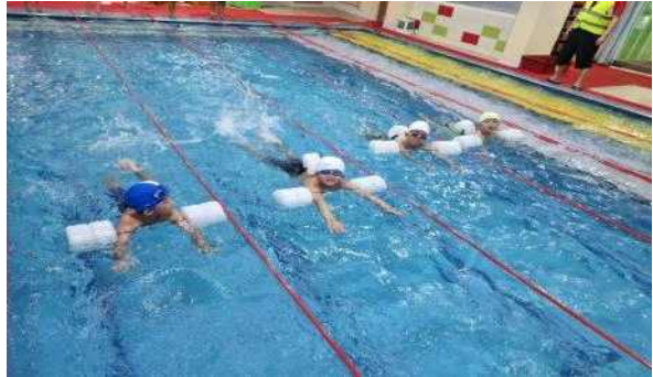
빨강띠 하는 모습