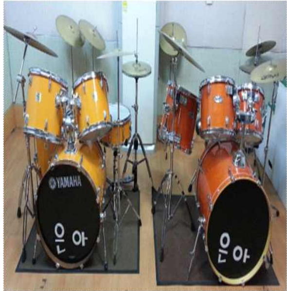
<마칭 악기 드럼>