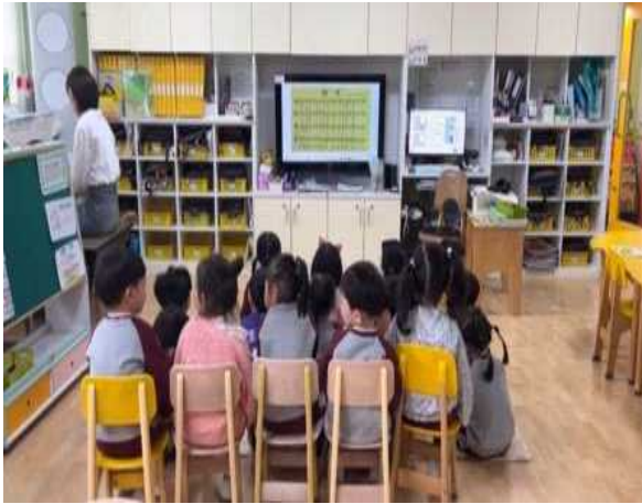
<선생님 피아노에 맞추어 새노래를 불러요.>