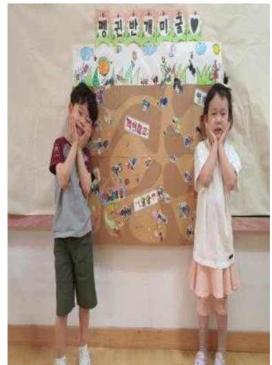
<프로젝트 마무리 및 공동작품 구성하기>