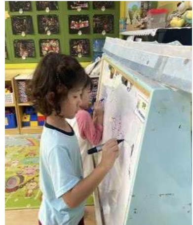
<쓰기 도구를 이용한 자유놀이>