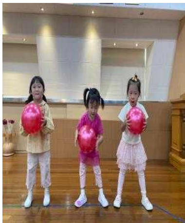
< 5세 - 공치기 >