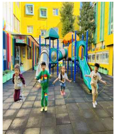
< 7세 - 줄넘기 >