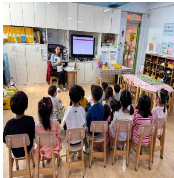
<교수자료를 이용한 활동>