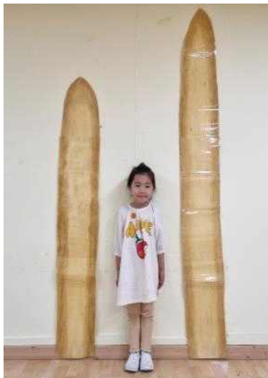
<길이를 직접 측정해보고 비교해보기>