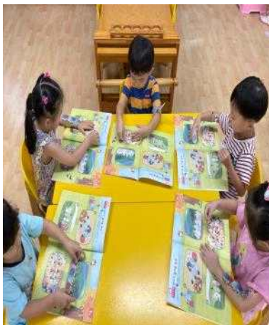
<5세 역사 독서 교육 - 교재활동>