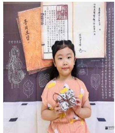
<7세 역사 독서 교육 - 결과>