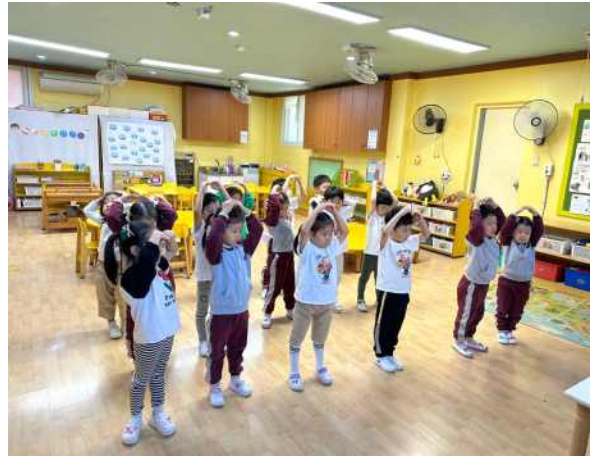
<동요를 듣고 율동으로 표현해요.>