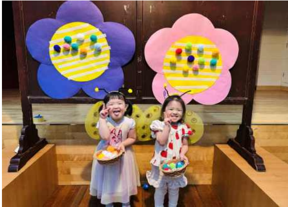
<즐겁게 게임을 해요.>