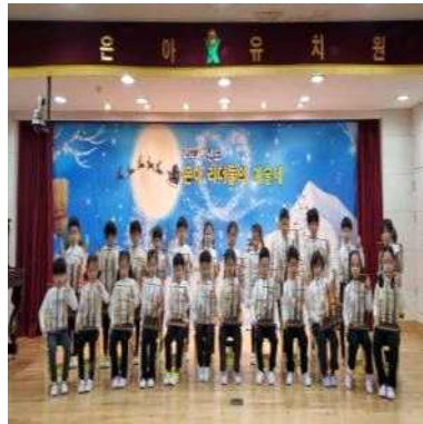
<6세 - 밤벨>