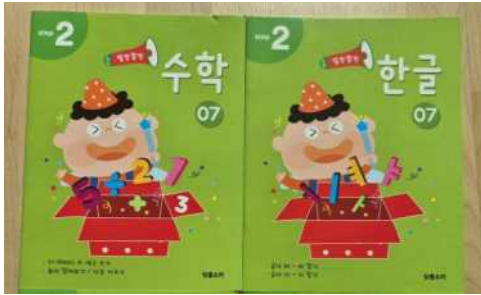
<한글, 수 활동 교재>