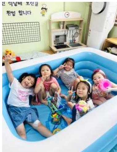
<가정연계자료를 사용한 자유놀이>