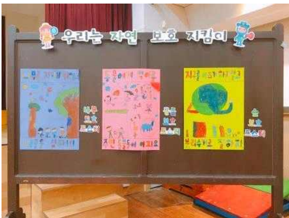
<동화를 감상하고 우리만의 방법으로 표현해요.>