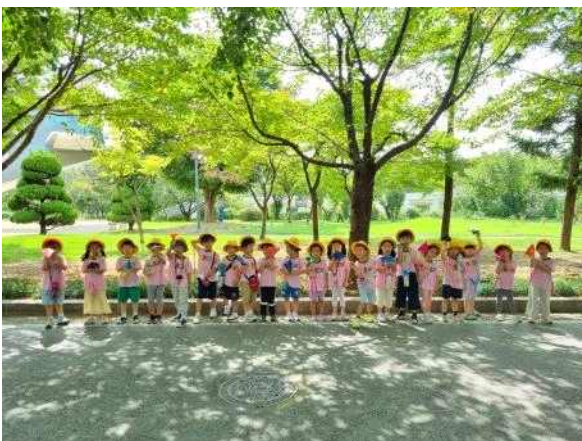
<봄철 숲 체험>