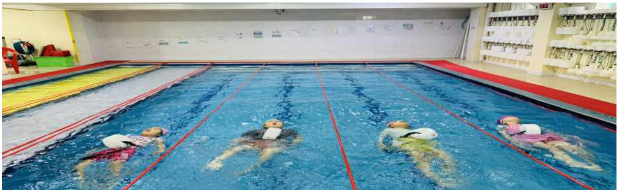
남띠 하는 모습