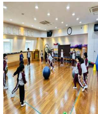
<짐볼을 이용해 게임을 해요>