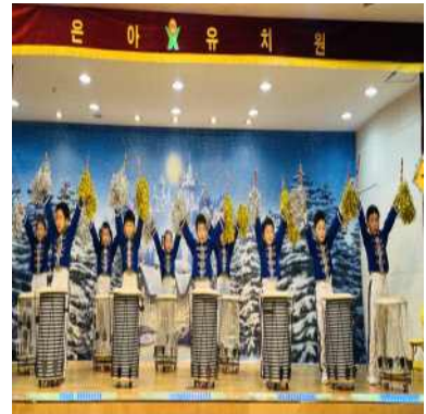
<7세 - 난타>