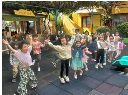
< 친구들과 마음껏 뛰놀며 바깥놀이 활동을 해요>