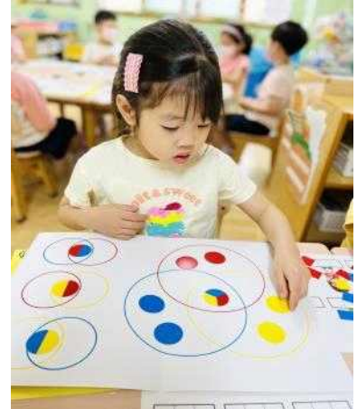
<피아제 하는 모습>