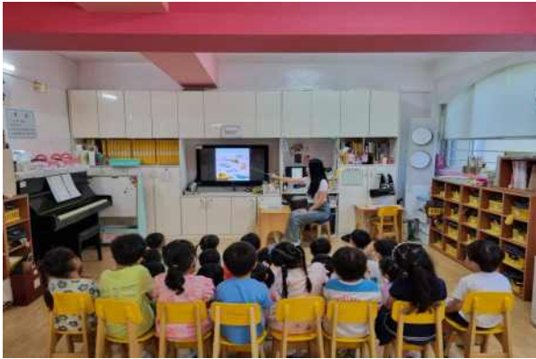
<다양한 교통기관에 대해 이야기 나눠요.>