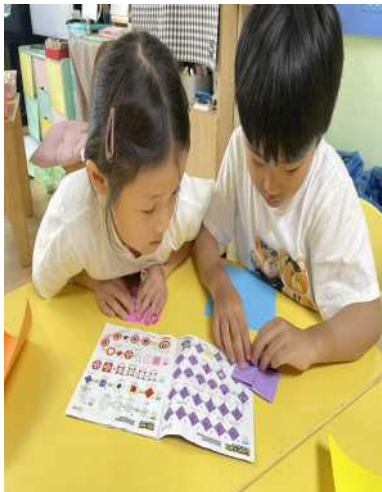
<색종이를 이용한 자유놀이>