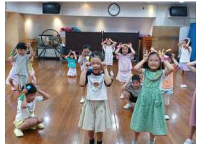
< 여러 가지 자료를 가지고 신체표현을 해요 >