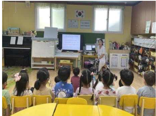
<음식을 골고루 먹어야하는 이유에 대해 알아보아요.>