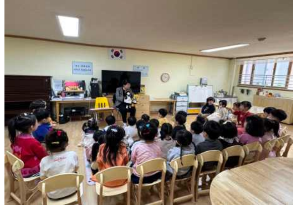
<바른 생각을 하는 은아어린이가 되어요.>