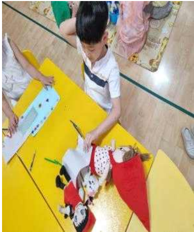
<손 인형을 이용한 자유놀이>