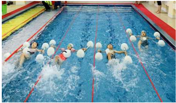
초록띠 하는 모습