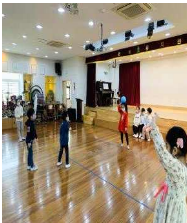
<친구와 함께 피구 놀이를 해요>