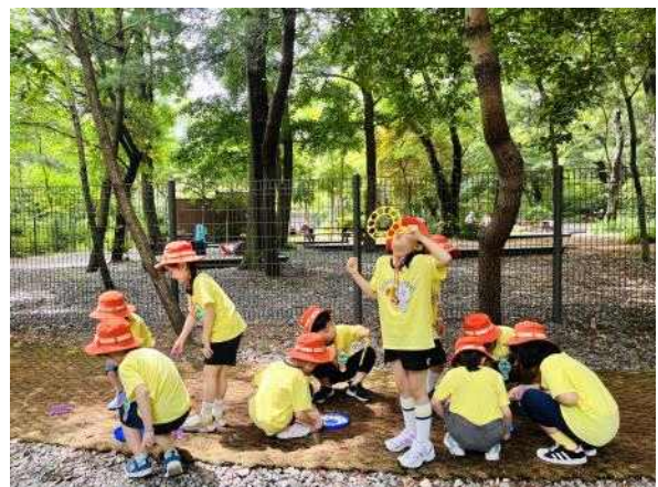
<가을 숲 체험>