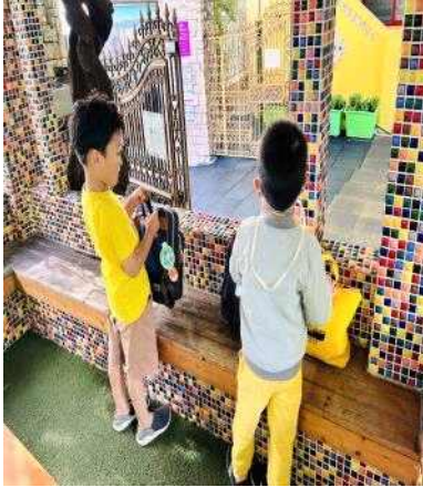
<등원하자마자 등나무교실에 가방을 놓은 후 운동장 달리기를 스스로 목표에 맞게 뛰는 모습>