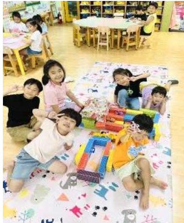
<블록을 이용한 자유놀이>