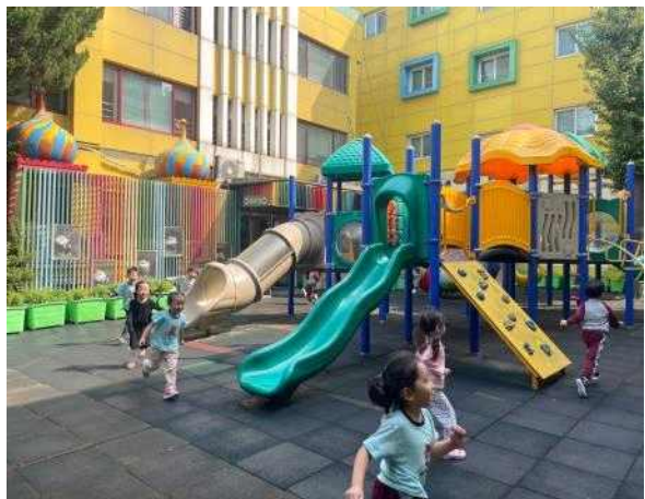
<친구와 약속을 지키며 사이좋게 놀이해요.>