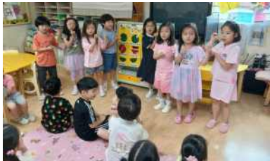
<친구들과 함께 노래를 배우고 불러보아요>