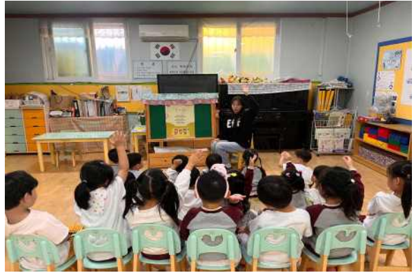
<동시를 함께 읊어보고 개작해요.>